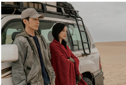
流西进行关内之行,寻找真相……

不同于一般的都市情感剧,《西出玉门》是少见的男女主“双强”设定。叶流西和昌东,都是经历过很多事,见过很多生死的人,他们的情感是在探险过程中彼此了解,逐渐建立起信任的基础上发展起来的,并非一见钟情的恋人,却是生死与共的知己。叶流西懂昌东,也懂他跟孔央的感情,所以在昌东和过去告别的时候,她选择给对方空间。而昌东也懂叶流西,懂她“穷且嚣张”的骄傲,并会选择继续陪叶