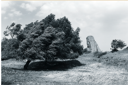
田相臣部分摄影作品