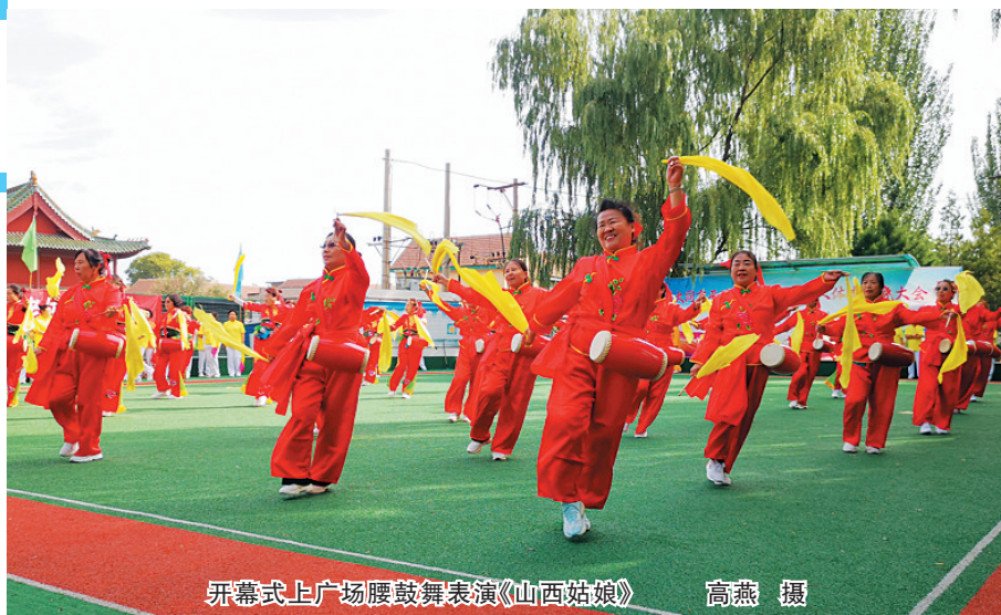
开幕式上广场腰鼓舞表演《山西姑娘》

据了解,此次体育健身大会吸引了1400名区直机关、事业单位和街道72周岁以下的退休老同志,分别报名参加拍球走、套圈、门球入门、双筷夹球、投沙包等5个人项目比赛。同时,68个街道、社区、村老年人健身活动站的1600多名老年人将参加健身操舞、传统武术、健身气功、广场舞等团体项目。