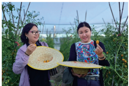
游客采摘有机果蔬

“风雨十年有机路，灵丘县以有机筑基，走出了一条以科带农、以科兴农、以工促农、以旅助农、城乡互动、三产融合的现代农业发展新路径。”中国农业大学农学院教授胡跃高说，以“车河”为代表的全域有机农业发展模式，必将为全国县域经济发展提供启迪与参考，为全国生态文明建设提供样板与路径，为人类命运共同体的建设提供借鉴与力量。