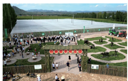
有机庄园游人如织