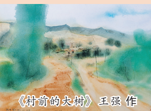
《村前的大树》王强作