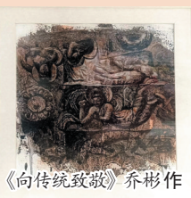
《向传统致敬》乔彬作