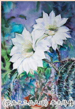
《花卉之三》钱志伟作