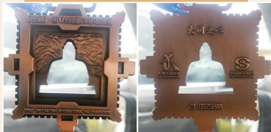
2017年大同首次马拉松奖牌