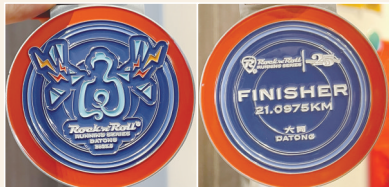
2023年大同摇滚马拉松奖牌

人生亦如马拉松。一直跑,奖牌只是见证和点缀,前进的动力和沿途的风景,才是犒慰历程的奖励;一如既往的初心不变,才能在越来越重的脚步和越来越酸的肌肉疲劳袭来时,奔跑依旧有力,眼中依旧有光。