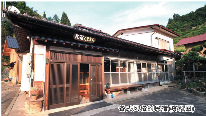
各式风格的民宿(资料图)