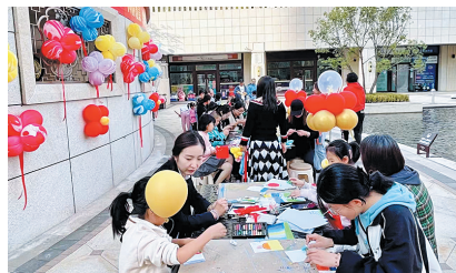
枫林逸景绘画手工主题活动

多位被采访的业主表示,物业服务对生活品质的影响立竿见影,好的物业让业主生活更方便、更舒心、更美好。真正的家,不仅是一处舒适的居所,更是一种温暖的生活感受。