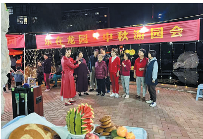
“乐在龙园”中秋游园会