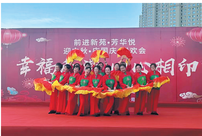
前进新苑·芳华悦迎“双节”联欢会