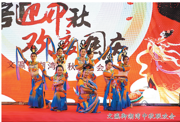
文瀛御湖湾中秋联欢会

俗话说“买房一阵子,物业一辈子”,物业的好坏直接影响到未来居住环境的舒适度。近年来,我市越来越多的物业公司注重提升服务品质,以细致周到的贴心服务、高效便捷的管理体系,为业主带来温馨舒适的品质生活。