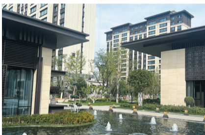
细节传递精致生活美学

国庆期间,记者来到瑞湖·云山府小区,绿荫植被连绵不绝,时令花卉别致唯美,流水蜿蜒,雾气弥漫,让人迅速从繁华进入闲适的静谧之境。在一步一景的多重园林中,与层叠错落的绿意景观一路相伴,让回家成为一场穿越风景的旅行。