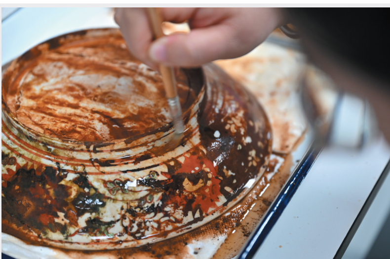
▲10月10日,中国(海南)南海博物馆的工作人员正在对文物进行清理、修复。