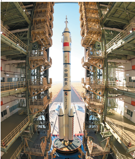
▲10月19日,神舟十七号载人飞船与长征二号F遥十七运载火箭组合体准备转运。

记者从中国载人航天工程办公室了解到,神舟十七号载人飞船与长征二号F遥十七运载火箭组合体10月19日已转运至发射区。目前,发射场设施设备状态良好,后续将按计划开展发射前的各项功能检查、联合测试等工作,计划近日择机实施发射。