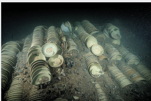
▲图为漳州圣杯屿元代沉船遗址船舱内码放的瓷器。

我国水下考古工作者已在南海西北陆坡一号、二号沉船遗址确认两处沉船的保存状况,通过海洋物理探测、载人潜水器水下调查以及三维影像和激光扫描记录等,提取出水瓷器、陶器、原木等近580件(套),实证了中国先民开发、利用、往来南海的历史事实。