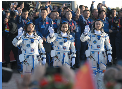
▲10月26日上午，神舟十七号载人飞行任务航天员乘组出征仪式在酒泉卫星发射中心问天阁圆梦广场举行。这是航天员汤洪波(右)、唐胜杰(中)、江新林在出征仪式上。