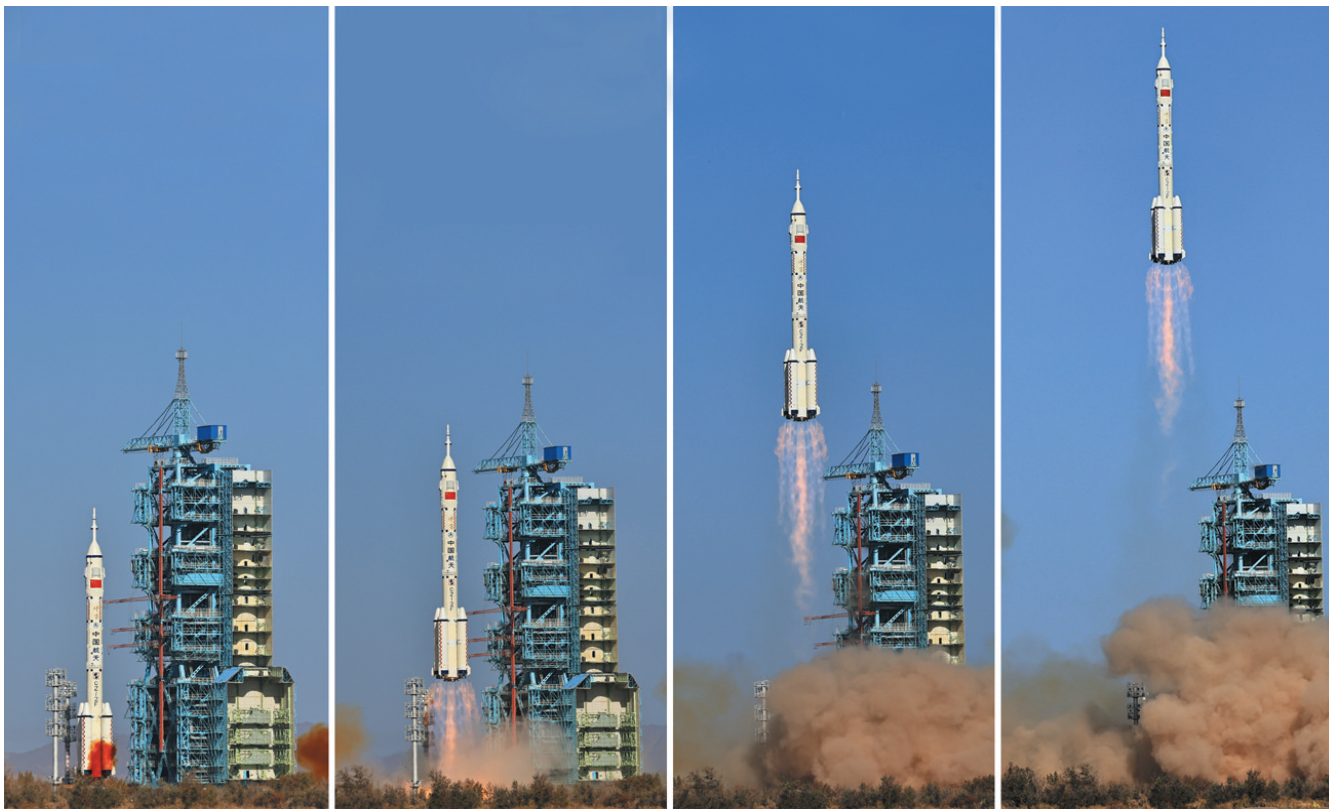
这是神舟十七号载人飞船发射升空过程(拼版照片,10月26日摄)。

神舟十七号是我国载人航天工程进入空间站应用与发展阶段的第二次载人飞行任务，此次发射正值我国首次载人飞行任务成功20周年之际，20年来我国载人航天工程发射任务实现30战30捷。本次任务有哪些看点？新任乘组“太空出差”干些啥？