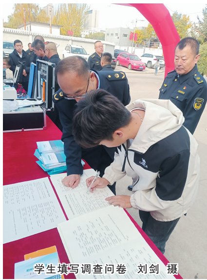
学生填写调查问卷