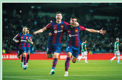
11月12日,巴塞罗那队球员莱万多夫斯基(左)与队友费兰·托雷斯在比赛中庆祝进球。

当日,在2023—2024赛季意大利足球甲级联赛第12轮比赛中,拉齐奥队主场以0:0战平罗马队。