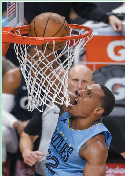
11月12日,灰熊队球员戴斯蒙德·贝恩在比赛中扣篮得分。

当日,在2023—2024赛季西班牙足球甲级联赛第13轮比赛中,巴塞罗那队主场以2:1战胜阿拉维斯队。