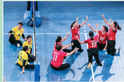
11月12日,中国队球员(右)在比赛中庆祝。

当日,在埃及开罗举行的2023坐式排球世界杯女子小组赛E组比赛中,中国队以3:0战胜蒙古国队。