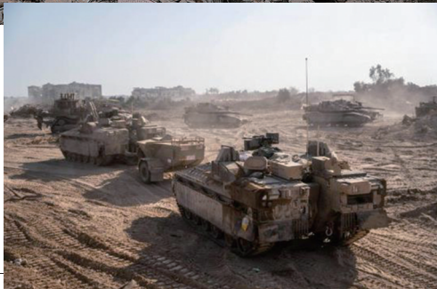
▶ 这张以色列国防军11月12日发布的照片显示,以军地面部队在加沙地带北部开展军事行动。

同一天,美国总统国家安全事务助理杰克·沙利文在美国哥伦比亚广播公司(CBS)《面向全国》电视节目中说,经卡塔尔斡旋,以色列与哈马斯正进行放人谈判。沙利文说,美国也深度介入该谈判。一名未具名美国高级别官员同时告诉CBS,眼下还没有互释遭扣押人员的协议,但不排除尚未完成的谈判最终协议中会包含这部分内容。