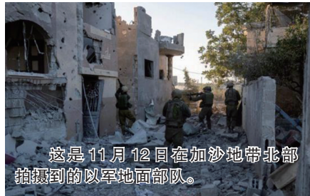
这是11月12日在加沙地带北部拍摄到的以军地面部队。

以色列国防部长加兰特13日说,随着以军全面占领加沙城,巴勒斯坦伊斯兰抵抗运动(哈马斯)“已失去对加沙地带的控制”。