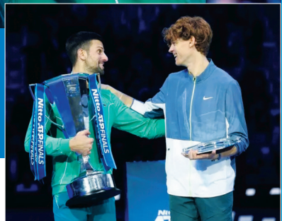
焦科维奇(左)与辛纳在决赛后

回顾塞尔维亚“天王”本赛季的表现，这位网坛传奇发挥堪称惊艳和完美。本赛季他取得了55胜6负的成绩，胜率超过九成，赛季收获7冠，大满