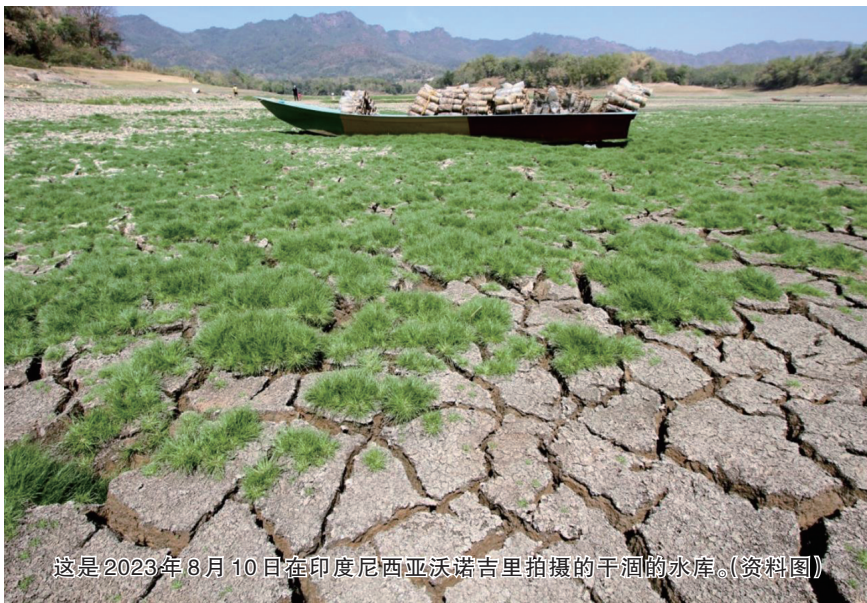
这是2023年8月10日在印度尼西亚沃诺吉里拍摄的干涸的水库。（资料图）

在这一背景下，11月30日至12月12日在阿联酋迪拜召开的《联合国气候变化框架公约》（以下简称《公约》）第二十八次缔约方大会（COP28）举世瞩目。本届大会需要完成《巴黎协定》的首次全球盘点，解决一系列关于落实的问题，并充分响应发展中国家和脆弱群体的关切，以找到关键问题的切实解决方案。