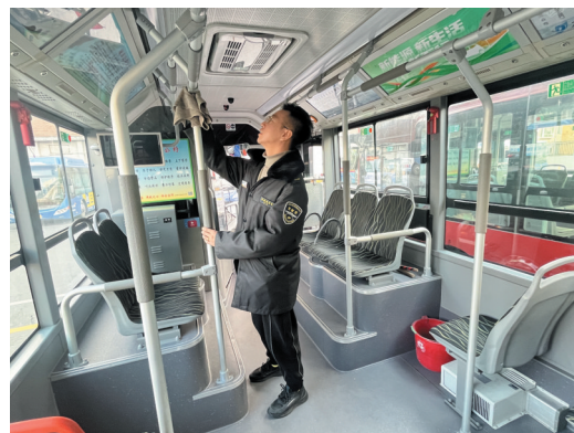
认真清理车厢卫生