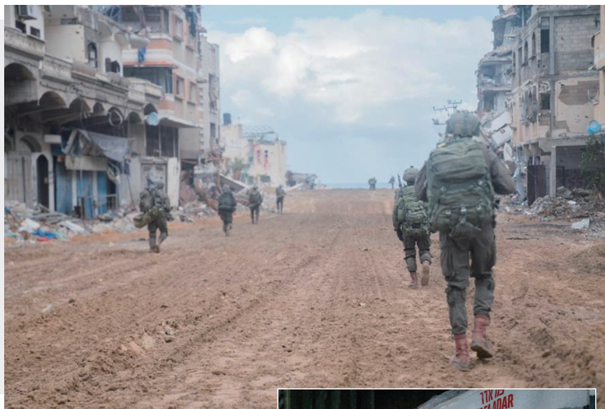
▲ 这张以色列国防军11月16日发布的照片显示,以军在加沙城西部地区进行军事行动。(资料图)

同日,巴勒斯坦伊斯兰抵抗运动(哈马斯)发布以方被扣押人员视频,三名老年男性呼吁以色列政府确保他们尽快获释。另据媒体报道,以色列、美国和卡塔尔三方代表18日在波兰首都华沙就巴以交换扣押人员问题举行谈判。