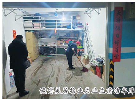
诚博美居物业为业主清洁车库

为了给业主提供更好的车库停车环境,近日,诚博美居物业对小区的地下车库进行了细致的卫生清洁。