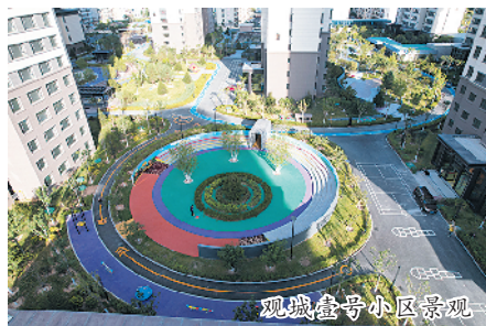
观城壹号小区景观