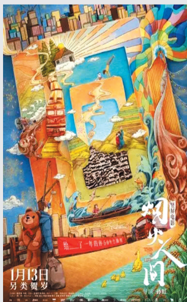
电影《烟火人间》海报