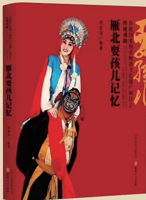
《雁北耍孩儿记忆》2019年出版

我是一名医务工作者，也是一名摄影爱好者。作为大同人，记录城市变迁和城墙故事，虽然不是我的本职工作，但是利用业余时间在这座城市留下点滴文化记忆，我感觉是有意义和非常幸运的事情。十多年来，我一直关注这一主题，不停地用相机记录着大同城墙的变化并留下数万张资料照片。从铲除第一锹杂草，到城墙修复合龙，再到今日大同古城以崭新的面貌迎接八方宾朋，无论春夏秋冬，酷暑严寒，我用镜头记录下百姓生活和城墙变迁的一个个瞬间，也见证了这段难忘的岁月。