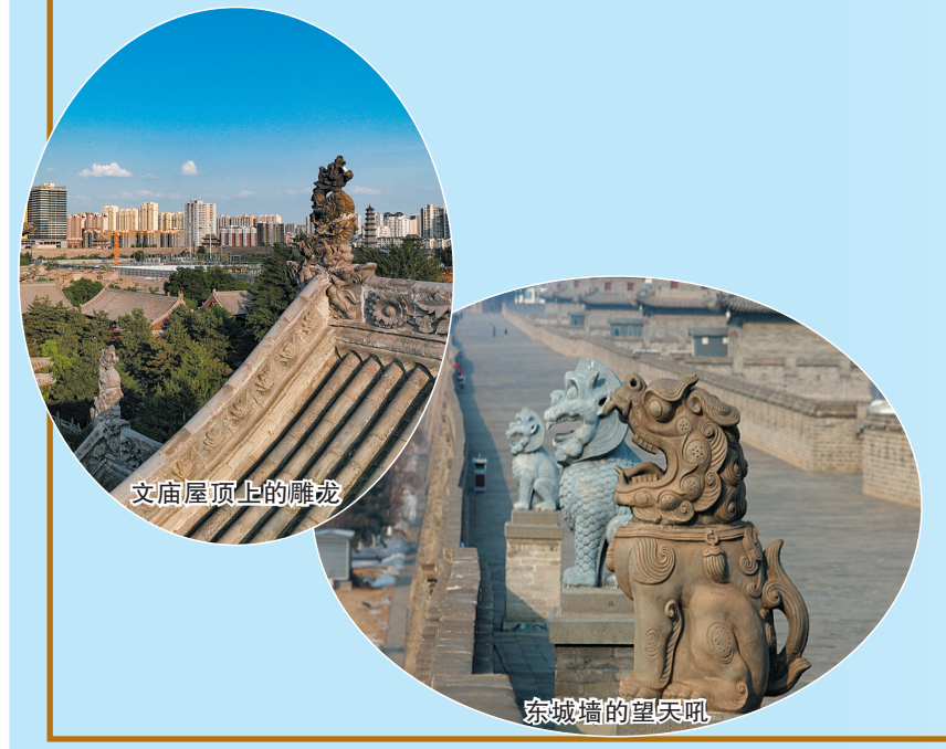
文庙屋顶上的雕龙