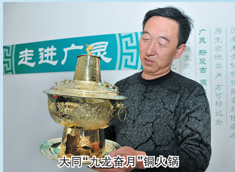
大同“九龙浴月”铜火锅