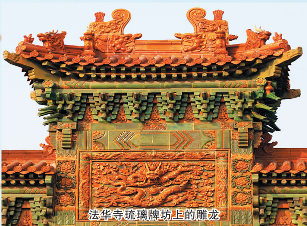
法华寺琉璃牌坊上的雕龙