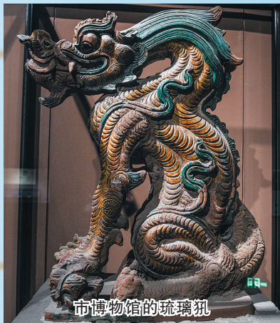
市博物馆的琉璃吼

大同素有“龙壁之城”的美称，保存至今的大型龙壁有9座，还有一些小型的龙壁散落在县乡街肆，龙壁之多，蔚成景观。现存的大同龙壁多建于王府、寺院和文庙门前，建在王府、寺院，有护佑尊贵之意，建于文庙门前，取鱼跃龙门、士子腾举之意。