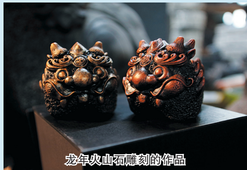
龙年火山石雕刻的饰品