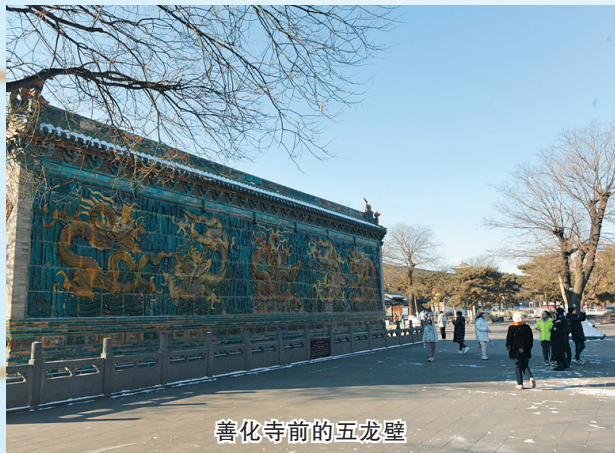
善化寺前的五龙壁