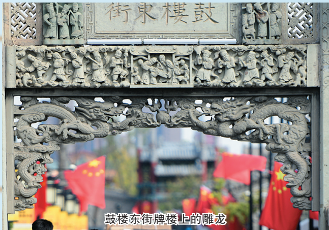
鼓楼东街牌楼上的雕龙