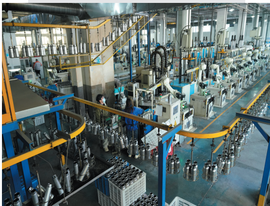
▲这是2023年12月21日在浙江省永康市一家保温杯生产企业拍摄的自动化生产流水线。（资料图）