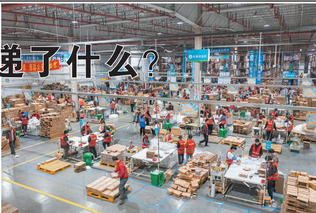
▲这是2023年11月12日拍摄的义乌综合保税区跨境电商打包现场。

这座不靠海、不沿边的城市，为何能连续多年保持快递业务量迅速增长？在一个个发往世界各地的包裹里，传递着怎样的信息？