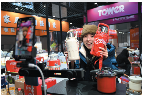
▲2024年1月10日，义乌国际博览中心A1馆电商工作人员在直播卖货。

“买全球、卖全球”，既满足了国内消费者多样化、个性化需求，又助力中国产品通达全世界，成为外贸发展重要动能。据了解，中国正加快完善面向全球的运输网络，力争到2035年基本实现国内1天送达、周边国家2天送达、全球主要城市3天送达的“全球123快货物流圈”。