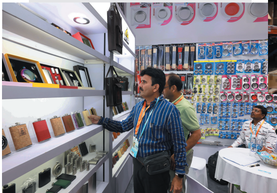
▲2023年10月21日，在义乌国际博览中心举行的第29届中国义乌国际小商品（标准）博览会上，外商在采购小商品。（资料图）

从2012年全市快递业务量1.7亿件到2023年突破136亿件。“电商与快递协同持续深化，不仅驱动着消费新增量，在增强经济活力和提升产业链条市场竞争力方面也发挥着重要作用。”金华市政府相关负责人说。