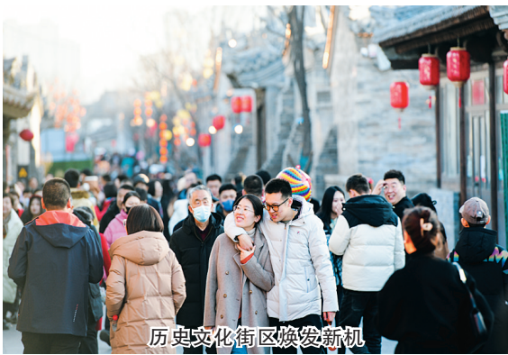
历史文化街区焕发新机