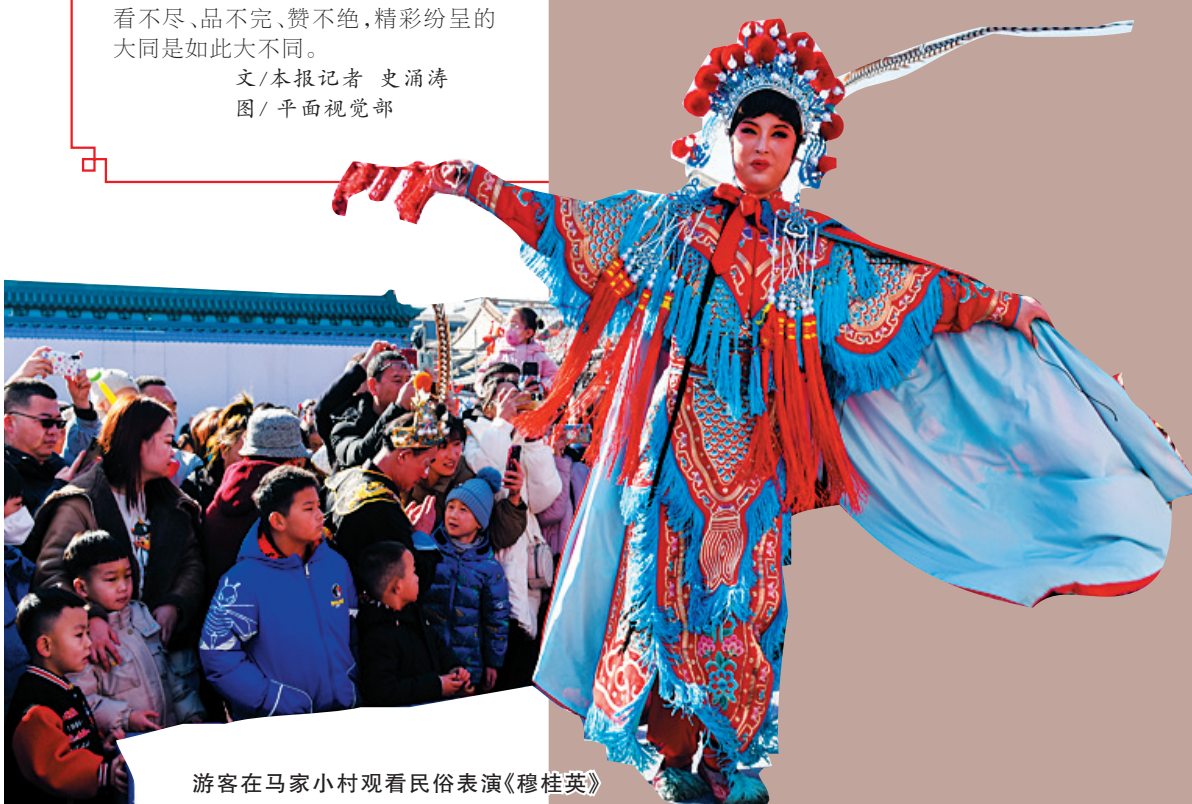
游客在马家小村观看民俗表演《穆桂英》