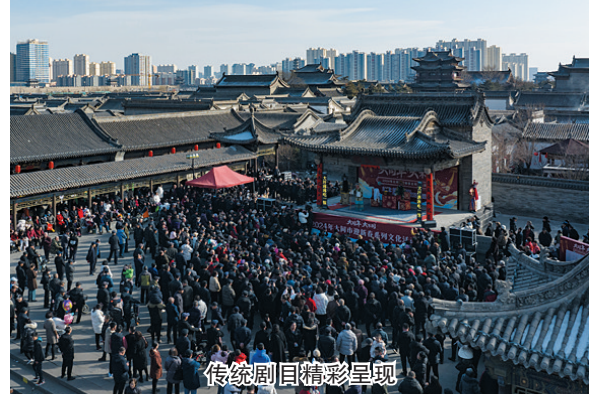
传统剧目精彩呈现