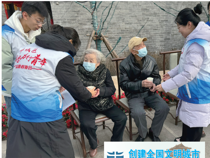
青年志愿者为来同游客提供饮用水。

青年志愿者还通过“线上+线下”相结合的方式,将青春的朝气与历史的古蕴融合,以街头“快闪”形式邀请来同游客共赴新春文化盛宴,感受扑面而来的青春朝气,通过网络直播的方式向全国网友展示了大同青年的青春作为,让全国网友感受大同别样的年味。