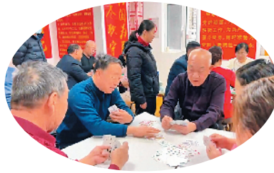
金茂园业主推龙比赛乐融融