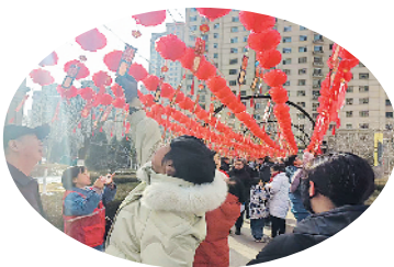
魏都金懋府业主猜灯谜