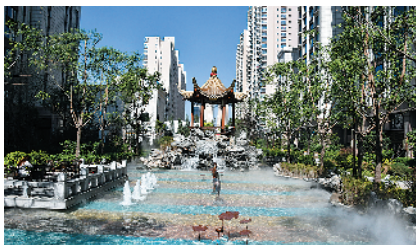
碧水云天·颐园二期

记者走访发现，返乡置业人群都有一个共同特点，那就是更关注开发商实力较强的高档楼盘，品牌性越强越受青睐。而从置业形态来看，返乡置业者对改善型住宅的需求更大，除了自住以外，也有很多人是为了给父母和家人一个更加温馨、舒适的居住环境，而低容积率社区、低密度社区、新型科技社区等高端住宅都是外地返乡置业人群的首选。