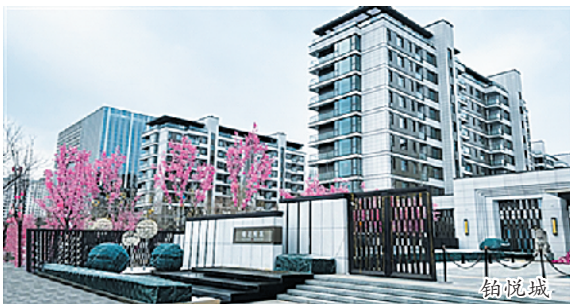
春节期间，许多售楼部门庭若市

看房人多了、成交量迎来了一个小高峰；春节不打烊，房企都“挺拼”……春节过后，大同楼市一开启便显现出新气象。近日，记者走访了我市部分楼盘售楼部，发现不少售楼部的人气比较旺，楼市活跃度要高于去年同期，一些楼盘在春节后迎来了开门红。