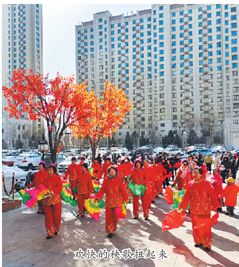
欢快的秧歌扭起来