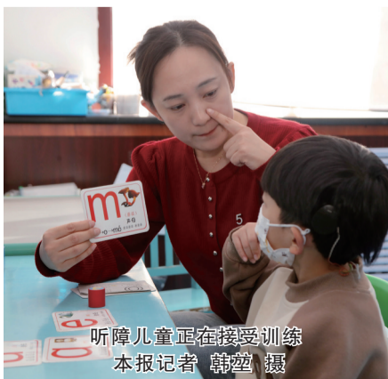
听障儿童正在接受训练