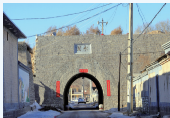
堡中心位置有楼阁基台，下有南北通道，券门有匾，一刻“永固”，一刻“凌霄”