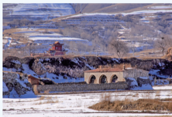
堡内外房舍多石砌，远处庙宇为玉皇庙，建于北城墙上