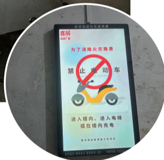
▲ 广告箱里播放的宣传片