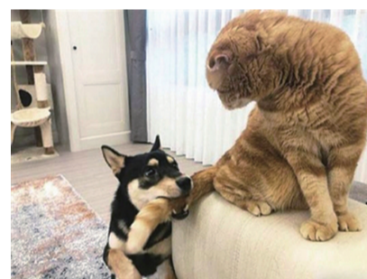
猫咪：“大胆，还不松口。”