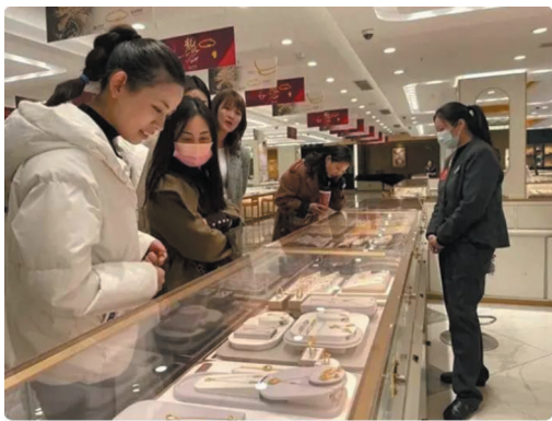
11日,消费者在上海一家金店选购黄金制品。