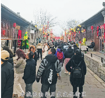
古城东南邑历史文化街区