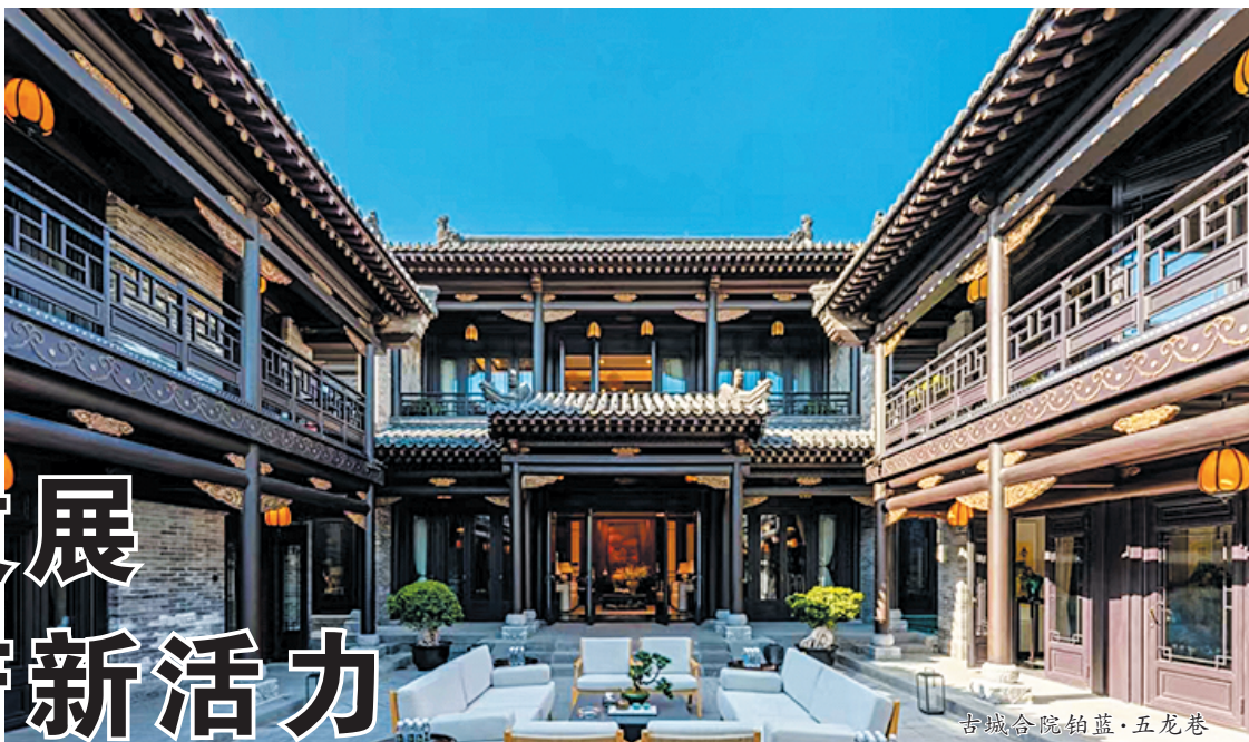
古城合院铂蓝·五龙巷