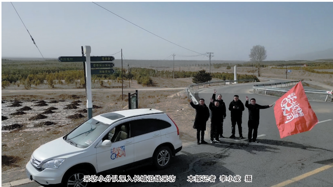
采访小分队深入长城沿线采访

从今日起，本报开设“沿着长城一号公路看大同”专栏，陆续刊发一线记者采写的稿件，敬请垂注。