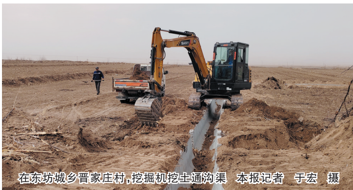
在东坊城乡晋家庄村，挖掘机挖土通沟渠

3月18日，尽管春寒料峭，却挡不住农民备春耕的脚步，一场“田间课堂”在浑源县裴村乡凌云口村开讲，吸引了周围十里八村的农民前来听课。