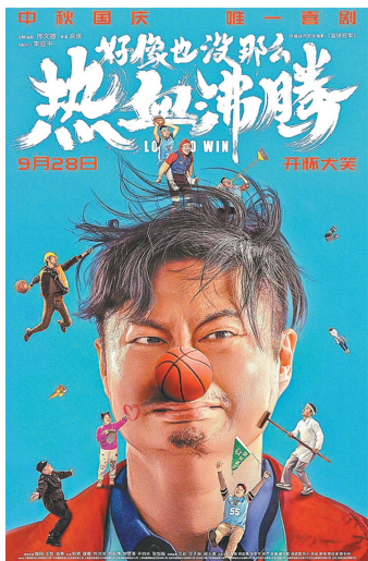
《好像也没那么热血沸腾》

近年来，翻拍国外电影已经成为中国电影创作中一个渐成规模的新渠道。但在实践过程中，如何对翻拍进行本土化，达到口碑和票房双丰收，却仍然是一道难题。