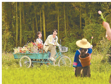
《你的岛屿已抵达》剧照