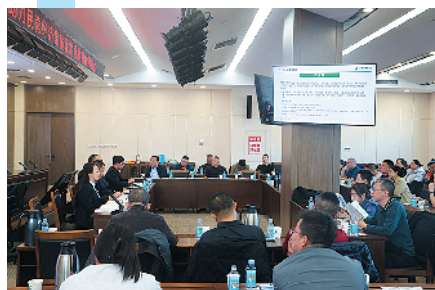
政银企三方讨论发展前景

本报讯(记者 刘江华 通讯员 郭晴丽) 为进一步深化政银企交流合作,有效解决民营企业融资难题,精准对接企业发展需求,3月19日,邮储银行大同市分行承办了金融助力民营经济高质量发展政银企对接会。市工商联相关负责人以及邮储银行大同市分行相关负责人出席了会议。