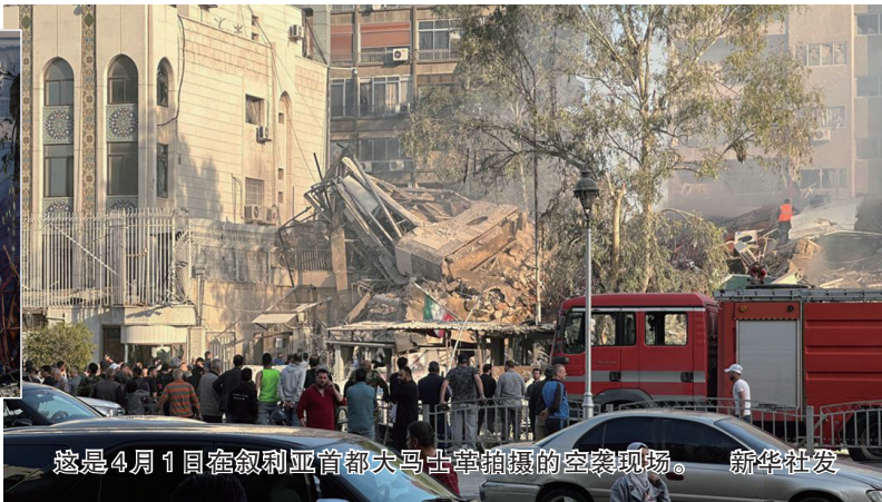
这是4月1日在叙利亚首都大马士革拍摄的空袭现场。

伊朗方面1日说,伊朗驻叙利亚大使馆领事部门建筑当天遭以色列导弹袭击,造成包括两名伊朗伊斯兰革命卫队将领在内至少7人身亡。叙伊两国强烈谴责以方的“野蛮”空袭,伊朗表示保留采取反制措施的权利。以军方对是否发动袭击不予置评,但多名以方匿名官员向美国媒体承认以方实施了此次行动。