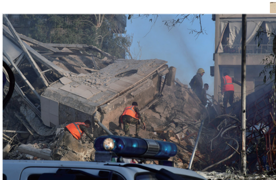
▲ 4月1日,在叙利亚首都大马士革,救援人员在袭击现场进行救援。