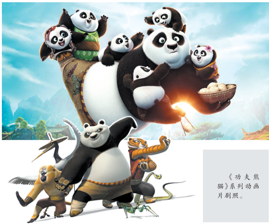
《功夫熊猫》系列动画片剧照。

3日,旅韩熊猫“福宝”正式返回中国,她的行程牵动着中韩两国人民的心。多年来,熊猫作为友谊使者,将中国人民的美好祝愿带向世界各地。无论《功夫熊猫4》成功与否,全世界范围内的“熊猫热”从未减退。