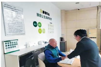
投递员在“邮爱驿站”体验便民服务

为传递金融关怀,邮储银行大同市分行依托“网点密、分布广、人员多”的自身优势,充分发挥“自营+代理”服务特点,积极履行社会责任,在原有的便民服务设施基础上,打造“邮爱驿站”,为有需要的社会公众提供更为开放、共享、公益的便民服务新体验。