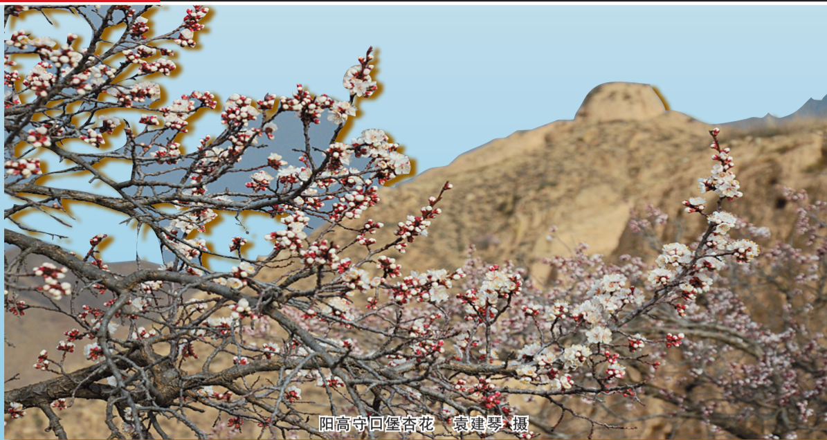
阳高守口堡杏花

顾祖禹《读史方舆纪要》载：“大同，长城界其北，雁塞峙其南，西眺朔漠，东瞻白登，屏全晋而拱神京，巍然重镇……”古都大同，桑干河宛如玉带环绕，内外长城如同臂膀拱卫；沿长城行来，塞上风光扑面而来，南过雁门关杏花疏影满眼妖娆，境内有北岳恒山等山川雄立，胡云汉月，古风幽草，共同筑就塞上大同殊异风光。