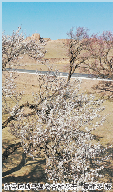
新荣区助马堡老杏树花开