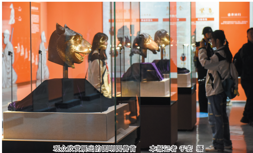
观众欣赏展出的圆明园兽首

此次展览在全新技术的支持下，具有历史厚重感的文物以全新的形式展示在观众面前，云冈第16—1窟窟壁原貌