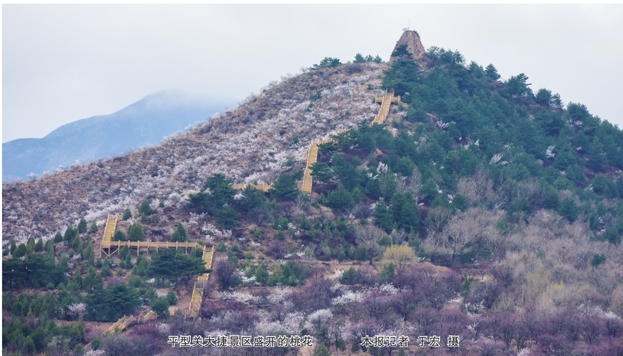
平型关大捷景区盛开的桃花