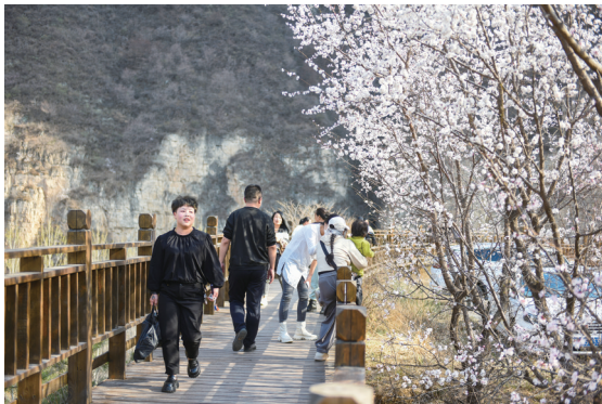
▲ 御射台的杏花吸引众多游客前来观赏