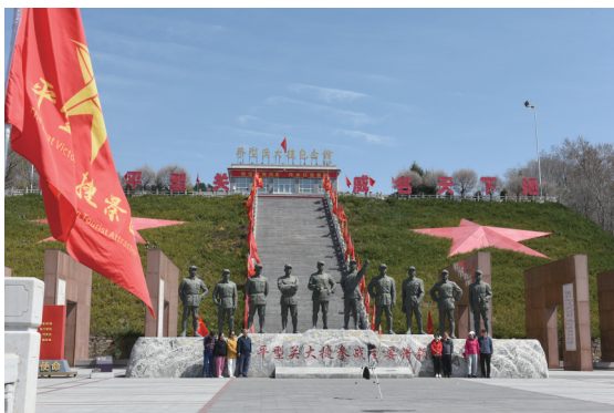
▲游客在平型关大捷纪念馆将帅广场合影留念