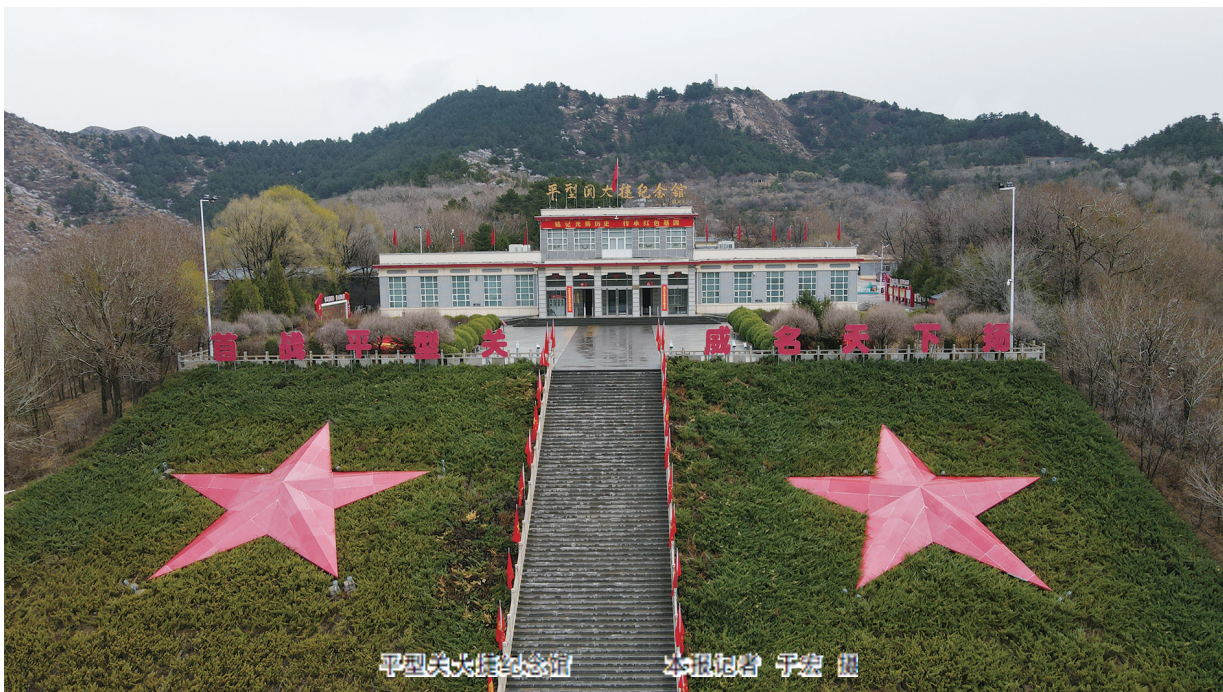
平型关大捷纪念馆