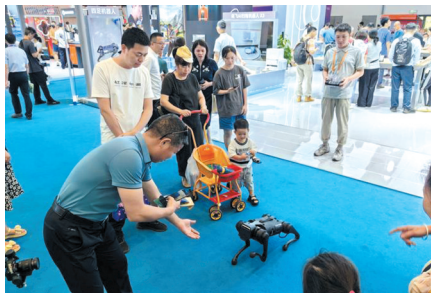
▲ 第四届消博会上，一款四足机器人产品引入围观。