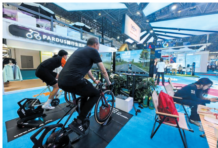
▲ 观众在消博会上体验可模拟各种山地场景骑行的自行车。