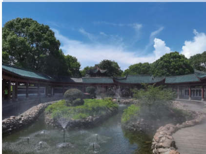
岳阳楼景区内的回廊