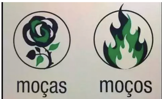
各种个性卫生间标识

近日, #老伯看不懂英文误入女厕被指非礼#登上热搜, 当事人反映, 由于商场厕所标识为英文和图案, 他误进女厕被指责。据媒体报道, 商场随即道歉并进行了优化整改。相信大家多少都会有类似的尴尬经历, 很多公共场所卫生间标识真的让人一时无法认清, 以至于走错卫生间的尴尬。现在的公共卫生间标识有那么难以辨认吗?