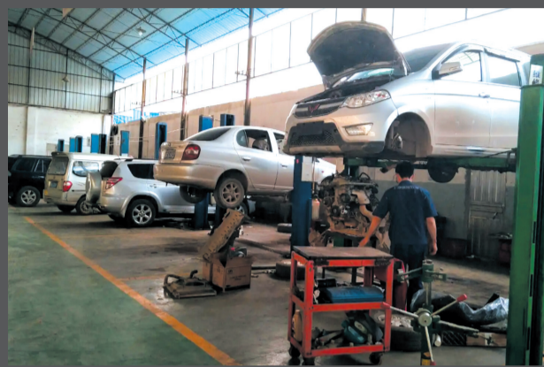
保险诈骗犯罪团伙经营的汽车修理厂。