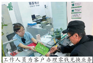
工作人员为客户办理零钱兑换业务

近年来，邮储银行大同市分行以“暖心支付零距离”为目标，采取多项措施着力提升特定客户群体支付服务体验。