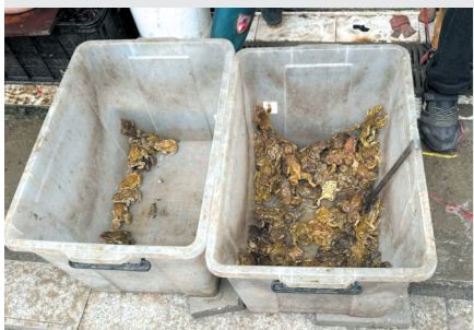
▲ 菜市场里的中华蟾蜍。