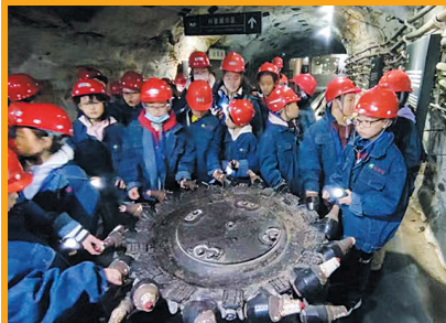
讲解员介绍采煤设备