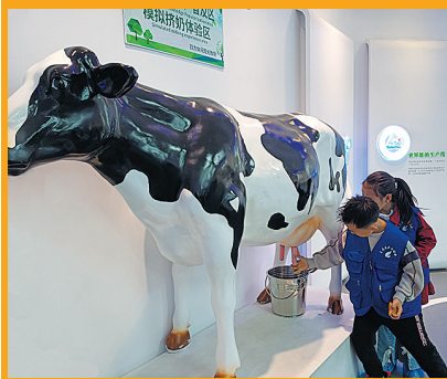
小记者们体验模拟挤牛奶

每一次难忘的实践活动,都让大同日报小记者收获满满。通过参与不同的主题实践活动,小记者从中学到许多课堂之外的知识,既开阔视野,增长见识,丰富阅历,又提高小记者的脚力、眼力、脑力和笔力。