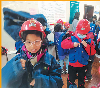
小记者们穿戴下井装备