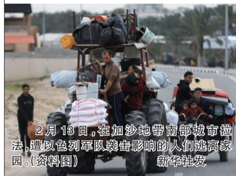
2月13日，在加沙地带南部城市拉法，遭以色列军队袭击影响的人们逃离家园。(资料图)

新华社耶路撒冷5月6日电 以色列国防军6日发表声明说，以军要求加沙地带拉法东部的居民尽快向“人道主义区”撤离。