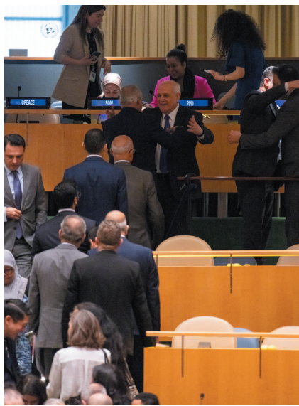
▲5月10日,在位于纽约的联合国总部,巴勒斯坦常驻联合国观察员曼苏尔(台阶上,面对镜头)在决议通过后接受祝贺。

根据联合国接纳新会员国的规则,申请加入联合国的国家须经安理会推荐,再由联合国大会决定,才能获得联合国会员国资格。如果安理会建议接纳该国,则该